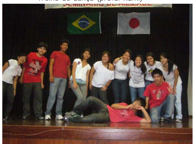
Apresentação de musical pelos alunos.